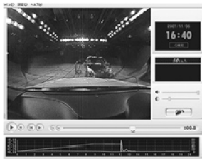
ドライブレコーダー パソコンでの画面表示例