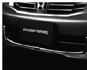
ガーニッシュ クロームメッキタイプ フロントドア用