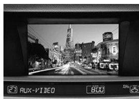
地上デジタルチューナー ナビ画面イメージ