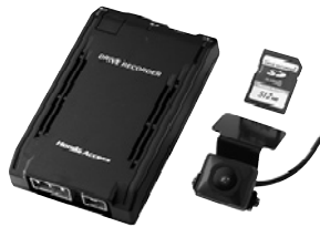
ドライブレコーダー 本体、広画角CCDカメラ、 SDメモリーカード