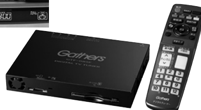
地上デジタル チューナー 本体