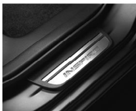
サイドステップガーニッシュ リア用