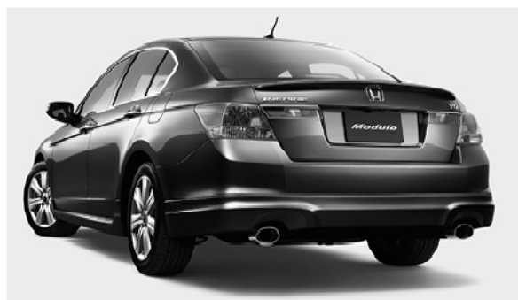
「インスパイア」 ディーラーオプション装着車 リア