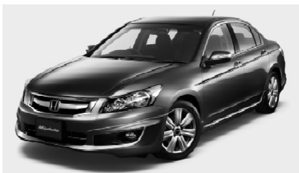
「インスパイア」 ディーラーオプション装着車 フロント