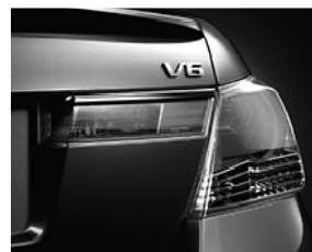
ガーニッシュ クロームメッキタイプ トランク用