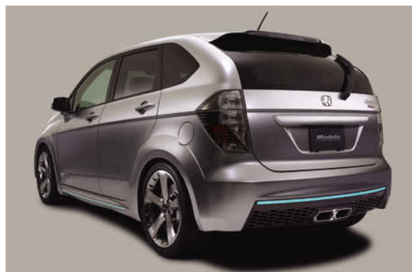
リアスタイリング