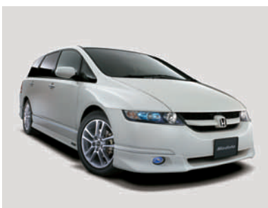
「オデッセイ」 モデュロ装着車(タイプZZ)