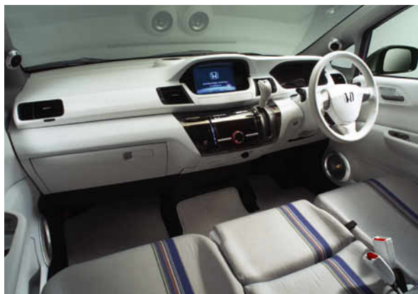
インテリアパネル