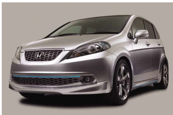
フロントスタイリング