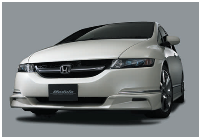
「オデッセイ」モデュロ装着車(タイプYY)

昨年末に発表したモデュロ新ロアスカート装着したオデッセイをはじめ、レジェンド、エリシオン、オデッセイ、オデッセイ アブソルート、エディックス、インテグラ TYPE Rのモデュロ装着車を会場展示し、Honda車とホンダアクセスのデザインとクオリティを融合させた「Honda純正カスタマイズ」の世界を紹介する。