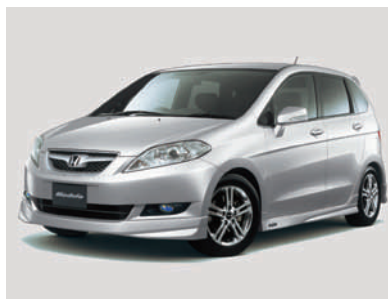
「エディックス」 モデュロ装着車