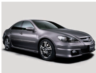
「レジェンド」 モデュロ装着車