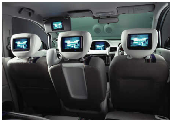
助手席バイザーモニター・フロントシートヘッドレスト内蔵