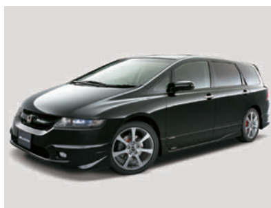
「オデッセイ アブソルート」 モデュロ装着車