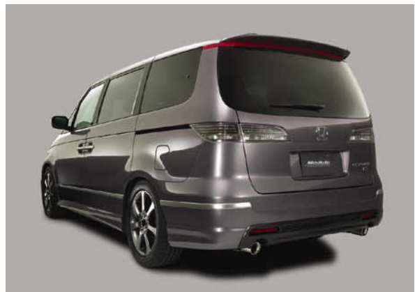
リアスタイリング