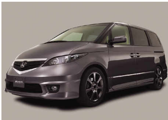
フロントスタイリング

レジェンド・モデューロ・コンセプトと印象を合わせたボンネットグリル、ダイナミックな面構成とシャープなエッジを組み合わせたフロント回りからエッジと弓形状を特徴としたロアスカートサイド(サイドシル一体タイプ)とフロントからリアへ流れるサテン塗装モール、さらに、ボディカラーに合わせた専用カラーのアルミホイール、3サークルを強調しスポーティ性を高めたヘッドライト、クリアレンズを採用し精悍さを演出するリアコンビランプなど、すべてがミニバントップグレードにふさわしいプレミアム感を演出するカスタマイズ提案となっている。