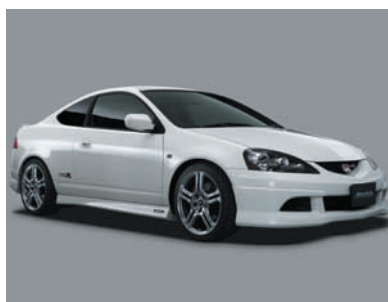
「インテグラ TYPE R」 モデュロ装着車

タイプZZとは… Honda車のニューモデル/フルモデルチェンジ時に車両と同時に発売されるロアスカートのタイプ名。 タイプYYとは…タイプZZの後、追加発売されるロアスカートのタイプ名。オデッセイのロアスカートタイプYYは2005年2月発売予定。