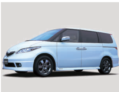
「エリシオン」 モデュロ装着車