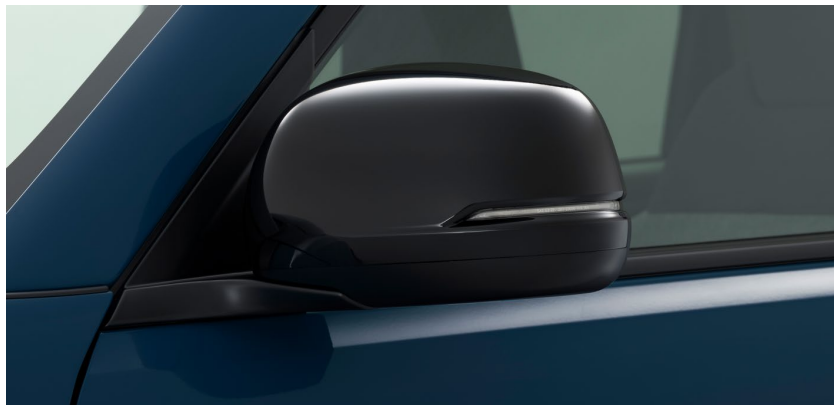
ドアミラーカバー

手軽に自分らしさを表現できる「ドアミラーカバー」が10位にランクイン。手ごろな価格のため、ワンポイントでのカスタマイズにぴったりなアイテムです。