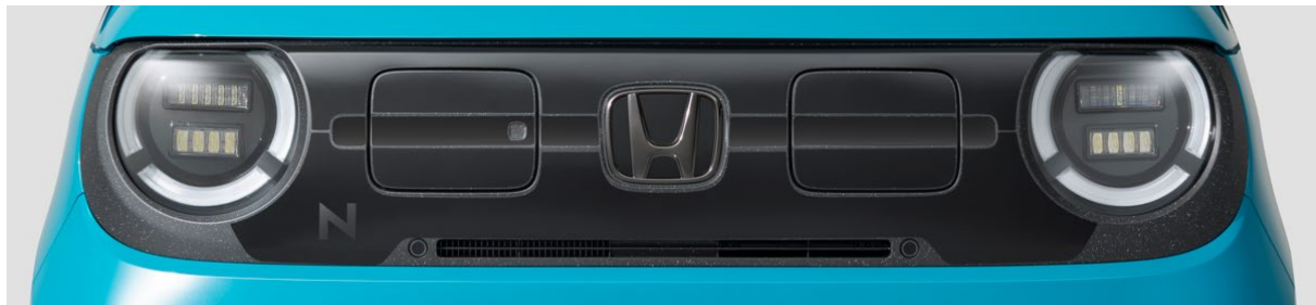
デカール フロントグリル ブラック

サステナブル材料で作られている標準装備のフロントグリルを、ブラックでコーディネートできるフロントグリルデカール。ブラックタイプと、シルバーの差し色が入ったシルバー×ブラックタイプの2種類を設定しています。「N」のロゴがさりげなくデザインされているのもポイントです。