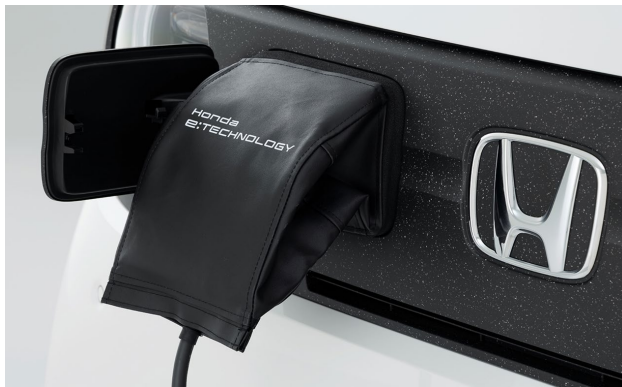
ポートリッドカバー

屋外での充電の際に気になるのが、充電ポートやコネクタの汚れ。ほこりや雨などから充電ポートを保護してくれる「ポートリッドカバー」が6位にランクイン。収納袋もセットになっていて、持ち運びも便利です。