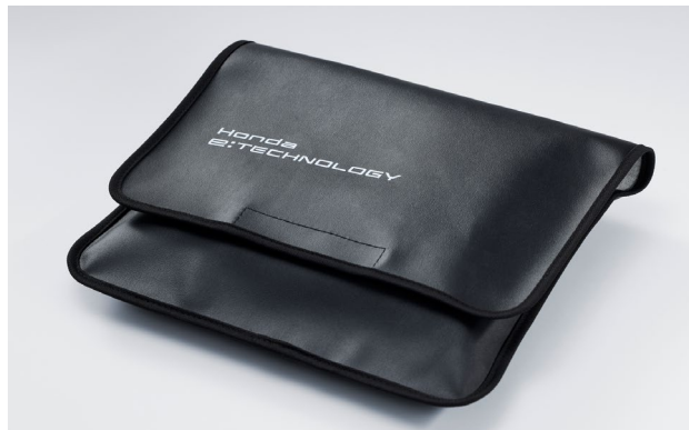
ポートリッドカバー収納袋