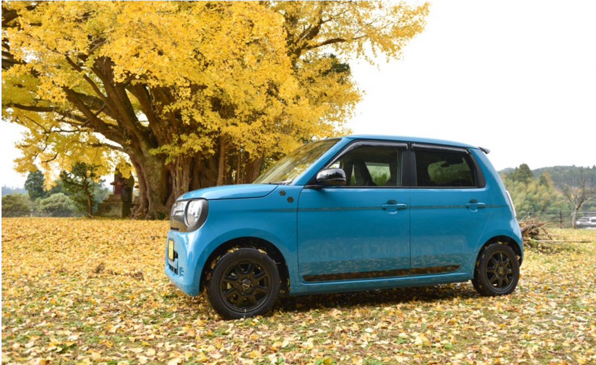
N-ONE e:純正アクセサリー装着車 “Sporty Style”

株式会社ホンダアクセスは、2025年9月12日（金）に発売した Honda「N-ONE e:（エヌワンイー）」用純正アクセサリーの人気アイテムランキング ※1 を紹介します。