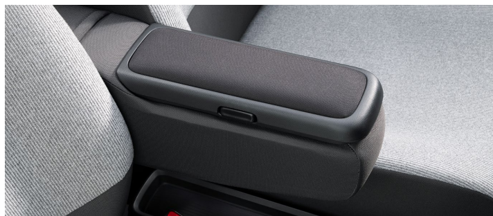
アームレストコンソール

N-ONE e:にアームレストが標準装備されていないこともあり、3位にランクインした「アームレストコンソール」。ひじ掛けとしてだけでなく、ガムボトルやメガネケースを収納できる蓋付のポケットと、駐車券ホルダーも付いています。