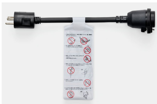
充電ケーブル 100V 充電用アダプター

※2 100V では満充電まで数日間を要します。日常の充電時の使用はお控えください