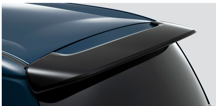
テールゲートスポイラー

「テールゲートスポイラー」が5位にランクイン。ガソリン車のN-ONE用の純正アクセサリとして設定している「テールゲートスポイラー」よりも大型で、N-ONE RS譲りのスポーティーな造形が人気です。