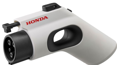
AC 外部給電器 (本体)

2 位にランクインした「AC 外部給電器」は普通充電ポートに差し込むことで、最大 1500W の電源を取り出すことができるアイテムです。N-ONE e:の走行用バッテリーから電源を取り出し、クルマを“モバイルバッテリー”のように使用することができるため、災害時や屋外のレジャーで活躍します。