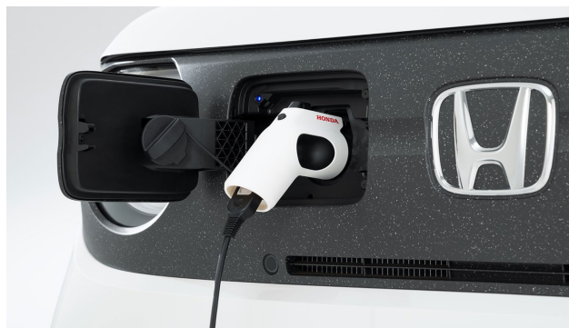
AC 外部給電器 (ポートへの接続時)