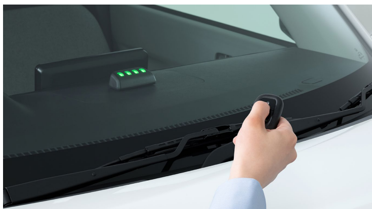
充電インジケータ

4位にランクインした「充電インジケータ」はバッテリー残量を車外から確認できるアイテムで、充電・給電時やドアロック操作時に緑色のLEDランプでバッテリー残量をお知らせ。AC外部給電器使用時も残量を表示できるほか、充電プラグの差し込みミス防止にも役立ちます。