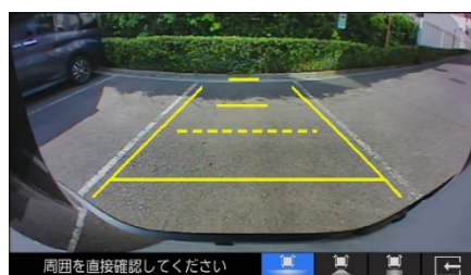
画面表示イメージ