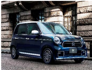
エクステリアイメージ クラッシーコーディネート (Premium 純正アクセサリ装着車)