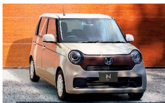
エクステリアイメージ ブラウンコーディネート (Original 純正アクセサリ装着車)