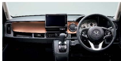
インテリアパネル ブリリアントカッパー