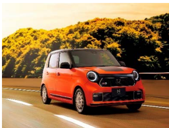
エクステリアイメージ ヘリテージホンダコーディネート (RS 純正アクセサリ装着車)