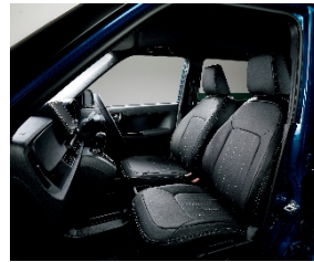
インテリアイメージ クラッシーコーディネート (Premium 純正アクセサリ装着車)