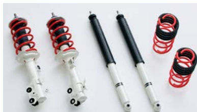
サスペンション RS 専用