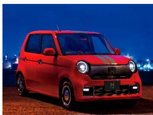
エクステリアイメージ カジュアルスポーツコーディネート (Original 純正アクセサリ装着車)