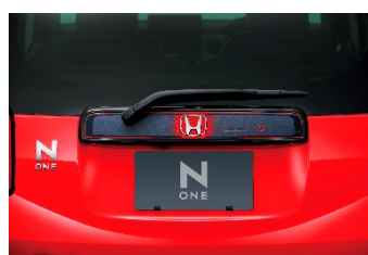
デカール ライセンスガーニッシュ カーボン