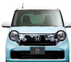
エクステリアイメージ スイートコーディネート (Original 純正アクセサリ装着車)

■ カジュアル スポーツ コーディネート —もっとカジュアルでアクティブに楽しみたい方に。