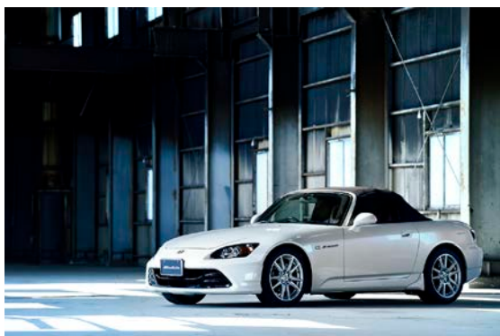
20周年記念アイテム装着イメージ（フロント）

※3…オーディオリッドは、2000個の限定販売となります。売り切れ次第、販売終了となります