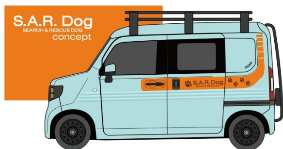
「S.A.R. Dog Concept」イメージ

※4 最大パレケネル 300 サイズ（約 W57×D81×H62cm）2個、200 サイズ（約 W52×D71×H53.5cm）1個を積載可能