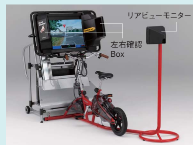
Honda 自転車シュミレーター