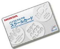
IDはカード裏面に記載

< web予約方法 > セーフティスクールのご予約はこちらから http://www.honda.co.jp/safetyinfo/ 携帯電話からのご利用はできませんので、あらかじめご了承ください。