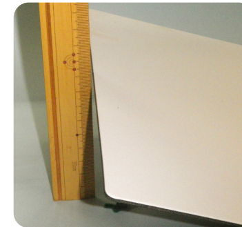
半分だけ小石を 入れたとき…10cm