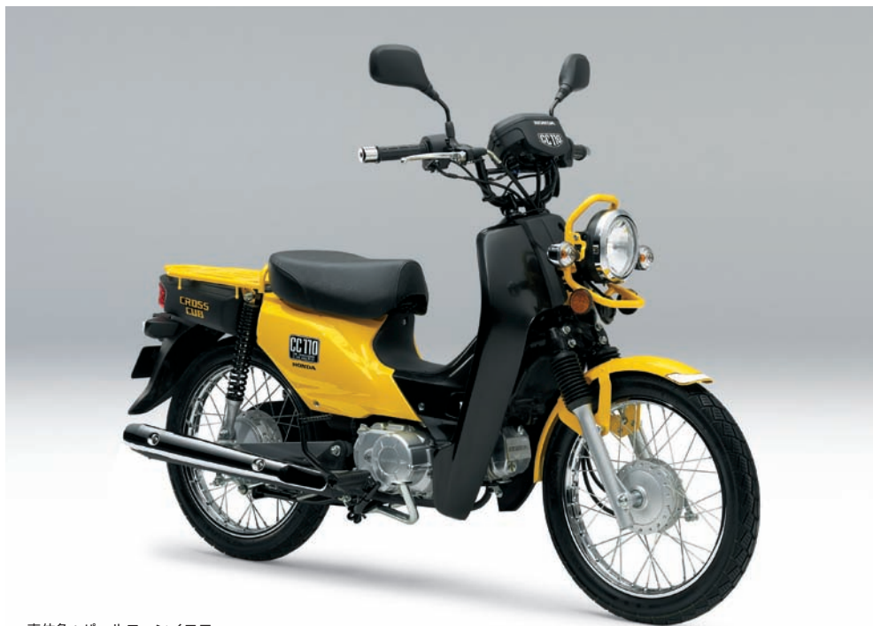
車体色：パールコーンイエロー

車体色は、パールコーンイエローとファイティングレッドの2色を設定。フロントフェンダーやリヤキャリアも車体色とし、レッグシールドやリアクッションスプリング、チェーンケースなどのブラックとのコントラストが鮮やかに映えるポップなカラーリングとしています。