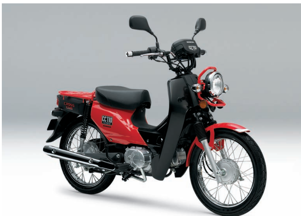
車体色：ファイティングレッド