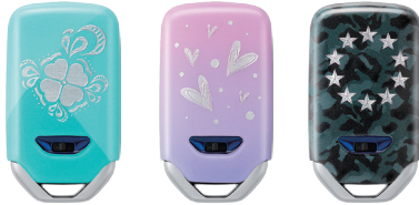
ハワイアンターコイズ ジュエルハート スターカモフラ