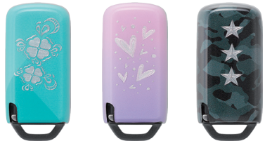
ハワイアンターコイズ ジュエルハート スターカモフラ