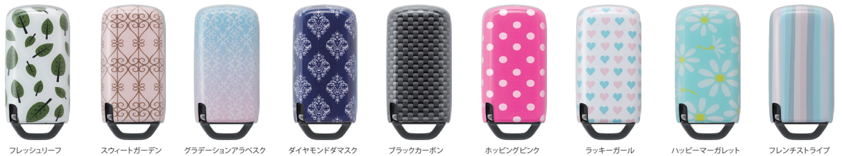
フレッシュリーフ スweetガーデン グラデーションアラベスク ダイヤモンドダマスク ブラックカーボン ホッピングピンク ラッキーガール ハッピーマーガレット フレンチストライプ