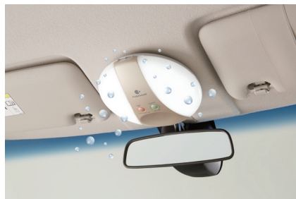
「ナノイー」うるケア・ヴェールライト 装着イメージ