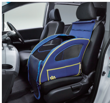
ペットシートプラスわん 装着イメージ

*2「ペットシートプラスわん」「ペットシートマット」は2014年10月下旬発売予定です。