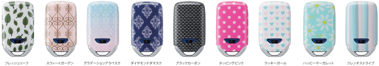
フレッシュリーフ スweetガーデン グラデーションアラベスク ダイヤモンドダマスク ブラックカーボン ホッピングピンク ラッキーガール ハッピーマーガレット フレンチストライプ