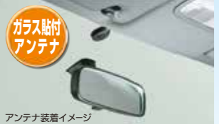
アンテナ装着イメージ

ガラス貼付アンテナ採用。アンテナ部にスピーカーを内蔵、音声案内が聞き取りやすくなりました。また、LEDランプでETCカードの挿入状態も確認できます。