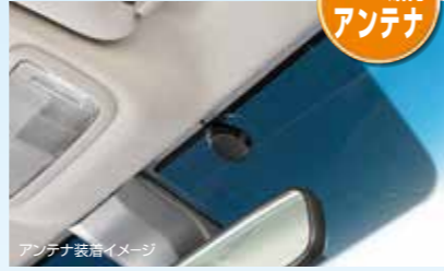
アンテナ装着イメージ

ガラス貼付アンテナ採用により、目立たない取り付けを実現。また、LEDランプでETCカードの挿入状態も確認できます。