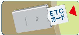
乗車時は車載器にETCカードを確実にセット。

ETCカードを車載器に確実に挿し込み、作動を確認してください。走行中のドライバーによるカードの抜き挿しは大変危険です。出発前や停車時に必ず行ってください。 ※ETCカードは必ずエンジン始動後に挿入してください。