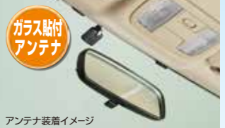
アンテナ装着イメージ

アンテナ部にスピーカーを内蔵し、通行料金のほかETCカードの有効期限も音声でお知らせします。 有効期限音声案内ON/OFF機能付。 LEDランプでETCカードの挿入状態も確認できます。