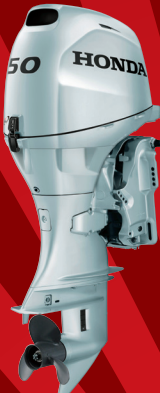
BF50D ロングティラーハンドル ¥844,800~(税抜¥768,000~) メカニカルリモコン ¥789,800~(税抜¥718,000~)