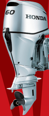
BF60A メカニカルリモコン ¥905,300~(税抜¥823,000)