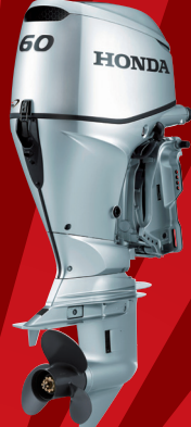
BFP60A メカニカルリモコン ¥938,300~(税抜¥853,000~) パワースラストモデル