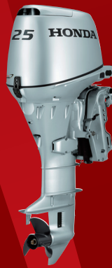
BF25D スタンダード/ロングティラーハンドル ¥547,800~(税抜¥498,000~) メカニカルリモコン ¥536,800~(税抜¥488,000~)