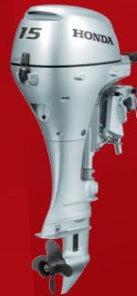
BF15D ティラーハンドル ¥294,800~(税抜¥268,000~)