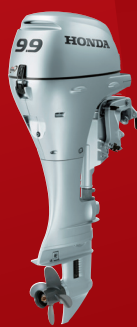
BF9.9D ティラーハンドル ¥242,000~(税抜¥220,000~) メカニカルリモコン ¥330,000(税抜¥300,000)