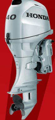
BF40D ロングティラーハンドル ¥789,800(税抜¥718,000) メカニカルリモコン ¥734,800~(税抜¥668,000~)